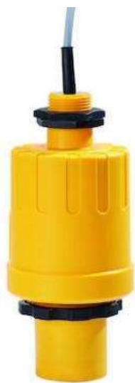
Câblage sortie 4/20MA