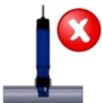
Vertical (90°) dans tuyauterie horizontale