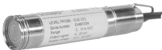
Transmetteur pour fluide chargé