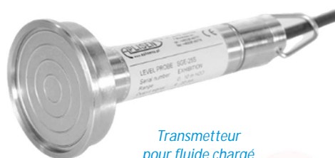
Transmetteur pour fluide chargé